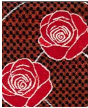
Artikel om Eva Rodenius, 3/07.