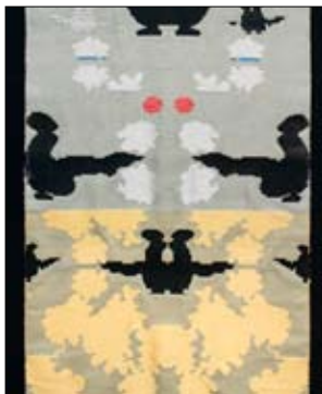
Artikel, Kaisa Melanton 1/07.