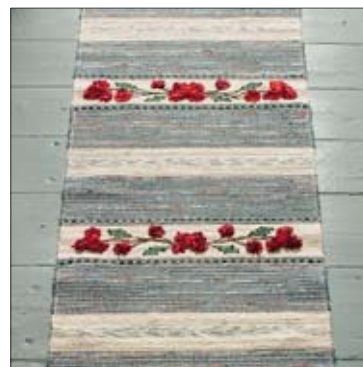
Vävbeskrivning slarvtjällsmattan "Drömmen om Elin" 2/06.