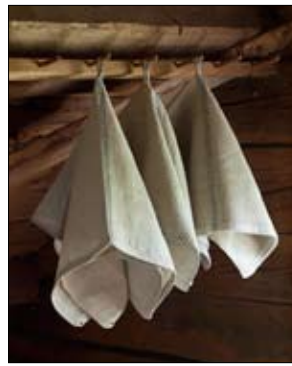
Vävbeskrivning till handduk med hank på mitten, 4/07.