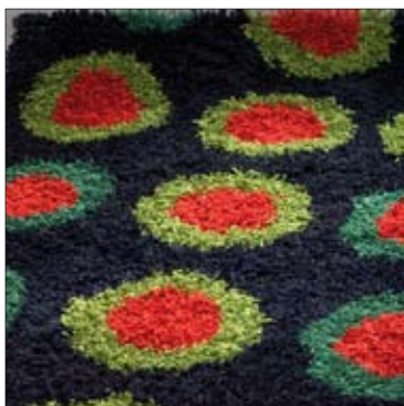
Vävbeskrivning ryamatta 1/06.