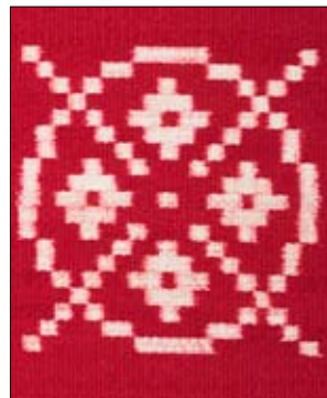
Artikel, Eva Stephenson-Möller 2/07.