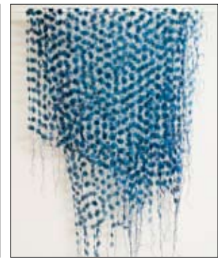
Vävbeskrivning Panellängd med Mattlin 3/06.