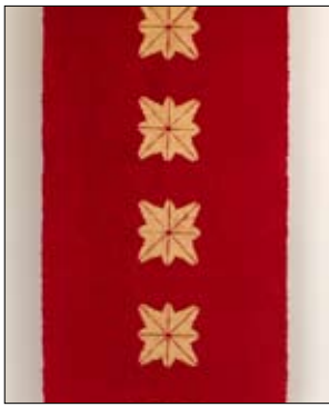
Vävbeskrivning till tryckt matta i lin 3/07.