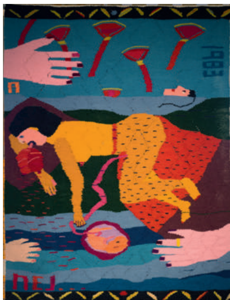
Lisskulla Lundqvist Prinsessan blek om nosen växer, 1983