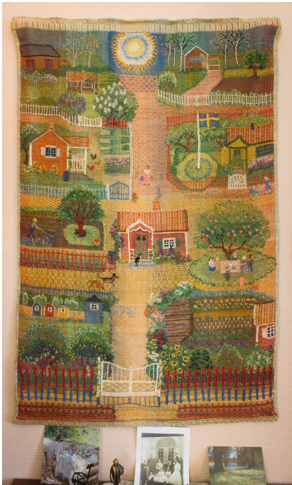
Liselotte Malmstens målning och bildväv av Bergshamra kolonistugeområde.