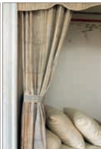
Tema: 1700-talet 2/08