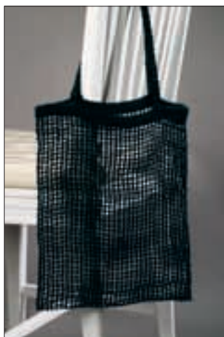
Vävbeskrivning: kasse i slingerbinding 1/08.