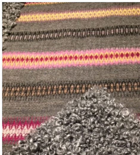
Nya och äldre vävnader på Utvandrarernas Hus. Utställningen pågår t.o.m. 28 januari.